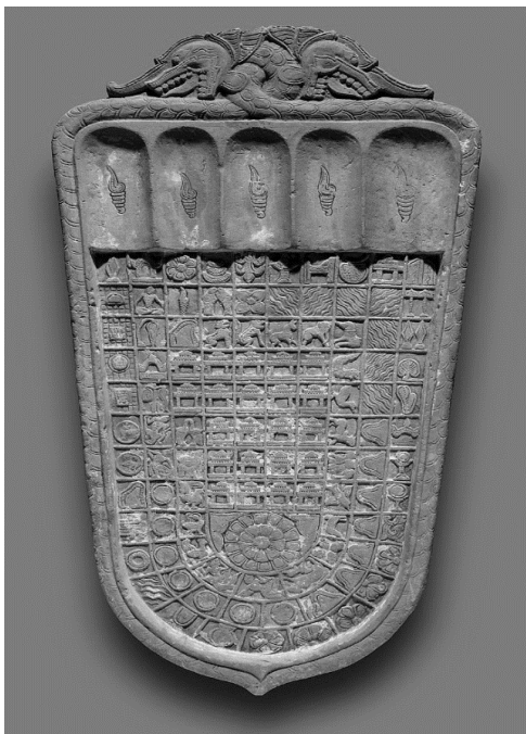
مقام بودا (میانمار)

در بررسی سیر تکامل علائم انحصاری، فرضیهٔ «تکامل توصیف متنی» چنین می‌گوید که در دورهٔ آنیکونیسیم، هنرمند ردپایی را که با چرخ تزیین شده بود، به‌عنوان نماد بودای حاضر (یا حضور در غیبت او) و تمرکز بر فداکاری‌های وی حفظ می‌کرد. چنین تصویرگری‌هایی بر متن تأثیر گذاشت که در قالب چرخ با هزاران سخنگو در پرتو خورشید نمود می‌یابد (همان، ص ۴۱). ازسویی دیگر، هنگامی که همهٔ ۳۲ علامت یمن و برکت تکمیل و قابل رؤیت شد، عملکرد نجات‌بخشی آن فراتر می‌رود و به‌عنوان ابزار عامی مدنظر قرار می‌گیرد؛ تاجایی که گسترهٔ اثربخشی آن آن‌قدر زیاد می‌شود که اثر بصری آنها جایگزین تعالیم بودا می‌شود و حتی دیدن آنها هم موجب بهبود جسمی می‌گردد (همان، ص ۱۰۱). به‌طور خلاصه دربارهٔ فلسفهٔ وجودی و کارکرد قدمگاه‌ها، به قدمگاه‌های بودایی اشاره شد.