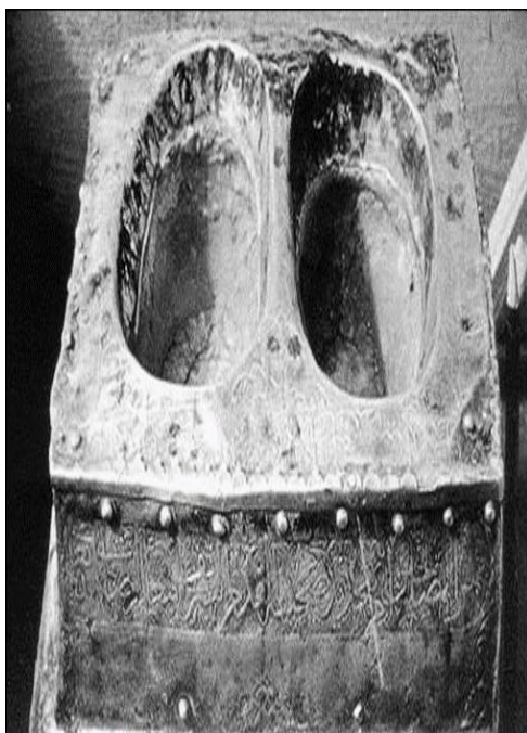
مقام ابراهیم (عربستان)